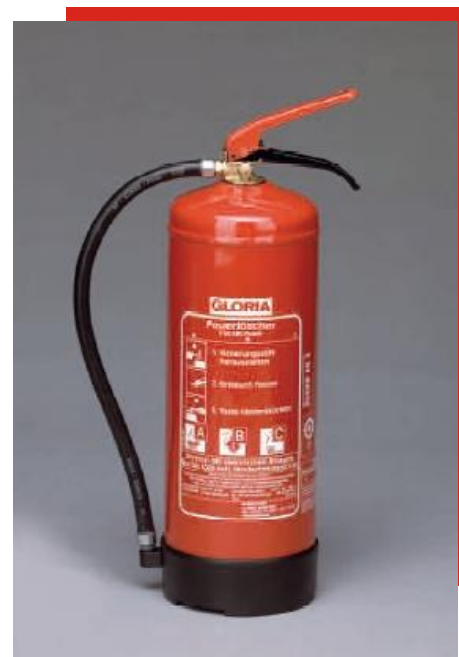
Extintor de polvo PD 6 GA