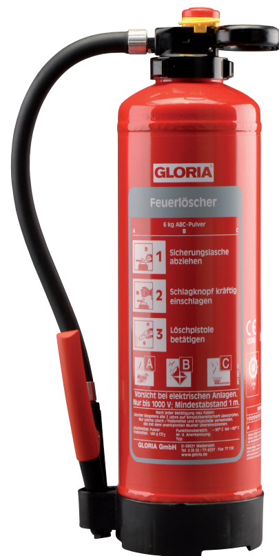
Extintor de polvo PH6PRO