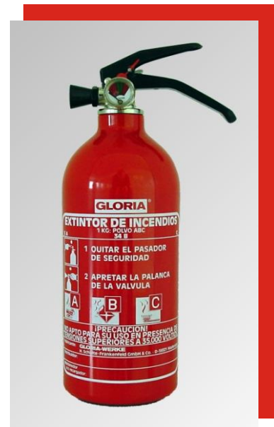
Extintor de polvo PD 1 GA