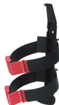
Soporte de transporte