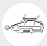
TIRADOR DE CABLE ACERO MODELO TCH Pág. 39