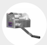
TORNOS MURALES MODELO TA Pág. 46