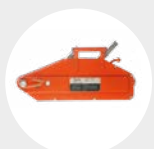
TIRADOR DE CABLE ALUMINIO MODELO TCAL Pág. 38