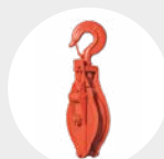
PASTECAS BISAGRA MODELO PBG Pág. 40