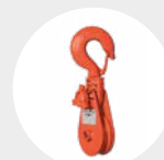
PASTECAS BISAGRA MODELO PG Pág. 41