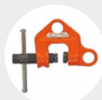
GARRA DE HUSILLO MODELO WF Pág. 54