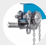
CARROS PORTA POLEAS INOXIDABLE SERIE 570 I