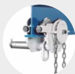
CARROS PORTA POLEAS ANTICORROSIÓN SERIE 580 AC