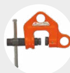
GARRA DE HUSILLO MODELO WF Pág. 54