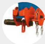
CARRO TIPO A SERIE 500 Pág. 22