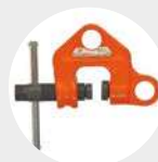
GARRA DE HUSILLO MODELO WF Pág. 54